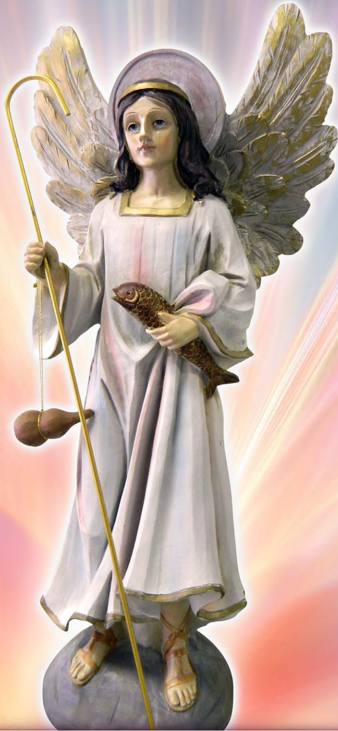
主保 聖辣法耳大天使 Arch Angel St. Raphael